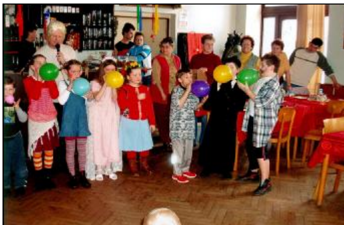
(Pokračování na stránce 9)

Finanční příspěvky našich sponzorů jsme využili na zakoupení odměn pro všechny děti na jejich maškarní veselí v sobotu 4. března. Za vtipného doprovodu oblíbeného DJ Charlese / M. Paula / si všichni nejen zatančili, ale soutěžili i